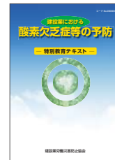
酸素欠乏症等の予防