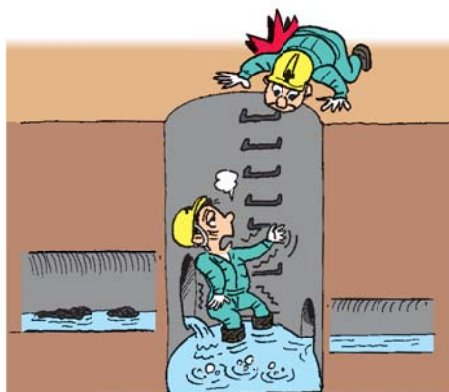
下水道工事での硫化水素中毒の例

酸素欠乏症とは、酸素濃度18%未満の空気を吸入すると発生する症状です。また、硫化水素中毒とは硫化水素濃度10ppmを超える空気を吸入すると発生する症状をいいます。