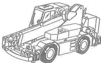
ホイールクレーン