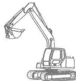
その他の移動式クレーン クレーン機能付ドラグ・ショベル