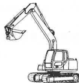
その他の移動式クレーン クレーン機能付ドラグ・ショベル