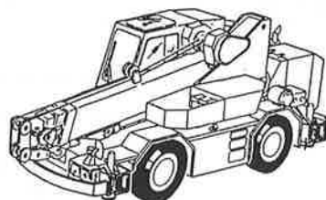
ホイールクレーン