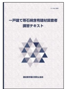
一戸建て等石綿含有建材調査者講習テキスト

※ 石綿作業主任者技能講習修了者は、一般および一戸建て等の両講習とも、科目「建築物石綿含有建材調査に関する基礎知識 1」（1 時間）が免除されます。