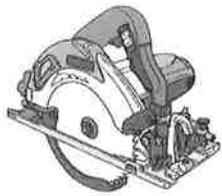
携帯用丸のこ盤（例）