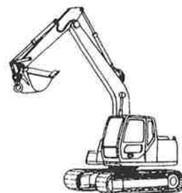
その他の移動式クレーン クレーン機能付ドラグ・ショベル